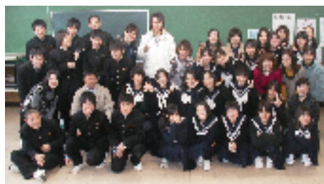
図3 幸中朝学クリスマス会での「生徒、講師、保護者の集合写真」

この会の発足後、毎回複数の保護者が会場に足を運び、色々な支援活動を実施した。活動は回を重ねる度、盛り上がりを見せ、講師に交じり生徒の質問に答えたり、反省会の中で講師と意見交流をされたりする等の活動を保護者の方がされるようになった。年末には幸中朝学支援委員会が主体となり、「講師と生徒の交流を深めること」「受験が目前に迫った生徒への激励」をねらいとして「幸中朝学クリスマス会」を実施した。講師と生徒は楽しい雰囲気の中で会食しながら交流を深めた。（図3）