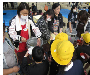
【会食のボランティア】

収穫祭はPTA会員及び地域を巻き込んだ全校あげでの伝統行事に育っており、以前は餅つきを通してのふれあい活動が中心でしたが、今回は、収穫までの体験や喜びを表現する場を重視する方向にシフトするようにしました。しかし、活動の支援は必要であり、収穫祭実行委員会（年3回開催…地域や元PTA30名+現PTA40名）に当日ボランティア60名が参加いただきました。実施の際は、餅つきと発表の時間帯を重ねないようにするなどの工夫をし、児童の発表が交代で見えるようにしました。児童もたくさんの参観者がいることが励みとなりました。