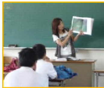
読書ボランティア